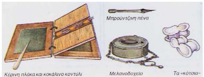
Κέρινη πλάκα και κοκαλινο κοντύλι